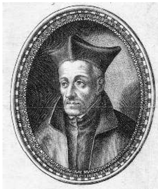
Figura 1: S. Pierre Favre, stampa del 17° secolo.

Nella sua intervista alla Civiltà Cattolica nel settembre 2013, papa Francesco parlò dell'influsso che Favre aveva avuto su di lui. Così come papa Benedetto XVI ci ha presentato s. Giovanni Vianney come un modello di sacerdote, così papa Francesco ci dà Pierre Favre, un uomo la cui vita e il cui ministero mostrano il sacerdozio missionario, che sta promuovendo vigorosamente in questi ultimi mesi, non da ultimo nella sua recente esortazione apostolica Evangelii Gaudium .