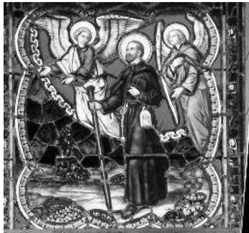
Figura 2: S. Pierre Favre, in una giornata missionaria, accompagnato dagli Angeli, vetrata.

L'esempio di Favre, come quello dato da papa Francesco stesso, è sia attraente che stimolante, perfino disarmante. In quest'epoca tecnologica Favre ci ricorda che non si può sostituire l'apostolato del contatto diretto, cioè coltivare la pazienza, la familiarità orante con Cristo, la comprensione delle vie di Dio nella propria vita e in quella degli altri, la disponibilità ad aiutare e il dialogo affettuoso con coloro che vedono le cose in modo molto diverso da noi. E se l'opera di evangelizzazione di Favre e dei suoi compagni ha avuto oltre modo successo grazie al coinvolgimento dall'intera persona, può essere così anche per la nostra.