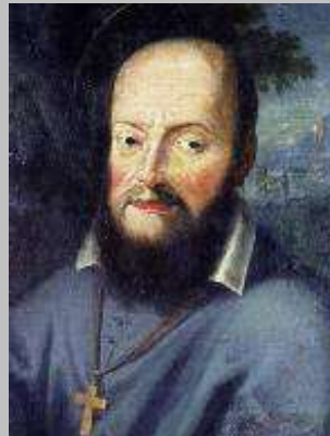
450° anniversario della nascita di s. Francesco di Sales 21 agosto 1567