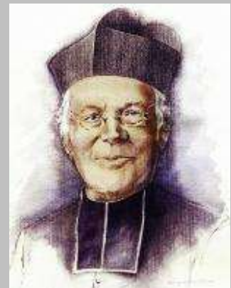
200° anniversario della nascita del beato Louis Brisson 23 giugno 1817