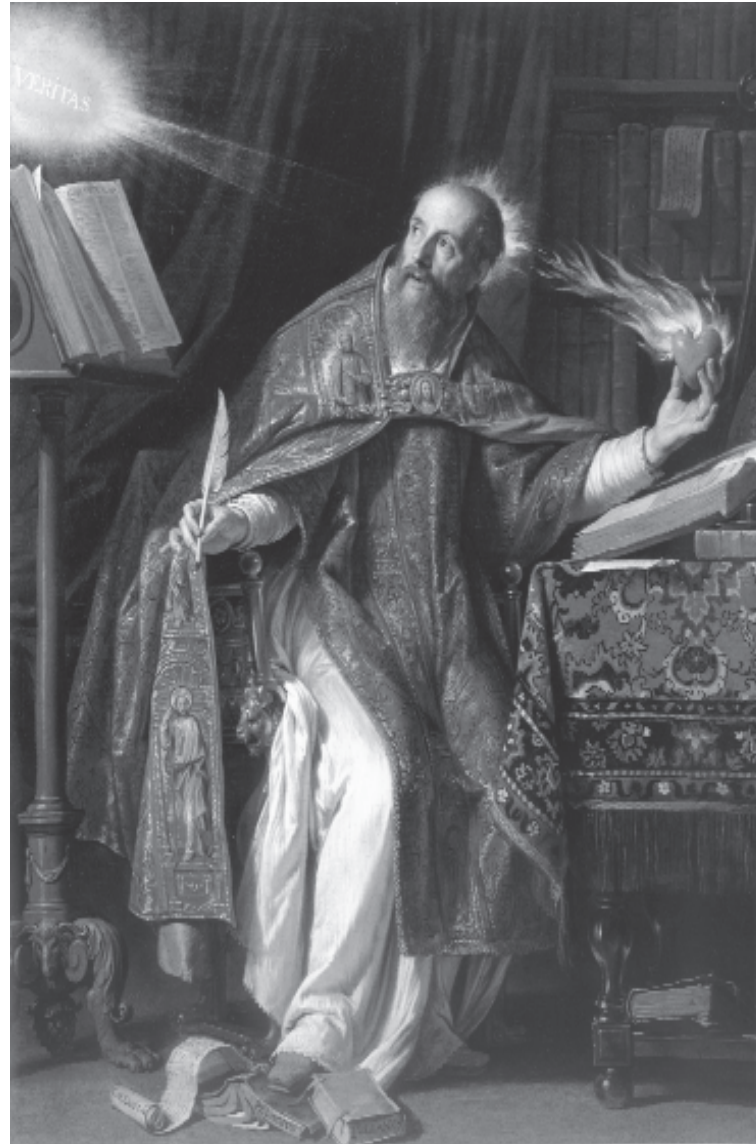
Figure 4. Philippe de Champaigne (1602-74), St. Augustine , ca. 1645-50, gravure sur toile. Musée d'Art de Los Angeles County, don de la Fondation Ahmanson. Cette peinture a servi de modèle pour François Chauveau pour la réalisation de la gravure de St. François de Sales Composant le Traité de l'Amour de Dieu (Figure 3), qui était le frontispice de la traduction latine de la biographie du saint par Henry Maupas du Tour, publié pour la première fois en français en 1657. néanmoins, à cause de l'application prématurée des appellations « bienheureux » et « saint » à François, Maupas du Tour était obligé de retirer cette édition de la circulation. Néanmoins, après la canonisation de François en 1665, la biographie de Maupas du Tour, accompagnée d'un récit de la cérémonie de canonisation, a été republié en plusieurs éditions.

Ces deux aspects de son icônographie sont simultanés sur certaines de ses images lorsqu'un attribut spécial est ajouté. En vérité, en dehors de la croix pectorale que, sur certaines gravures, François touche de ses mains et qui le