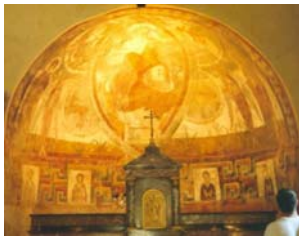
Fig 1 : Christ en gloire (10 e -12 e siècle) Chapelle de la forteresse des Allinges suivie d'un schéma d'identification.